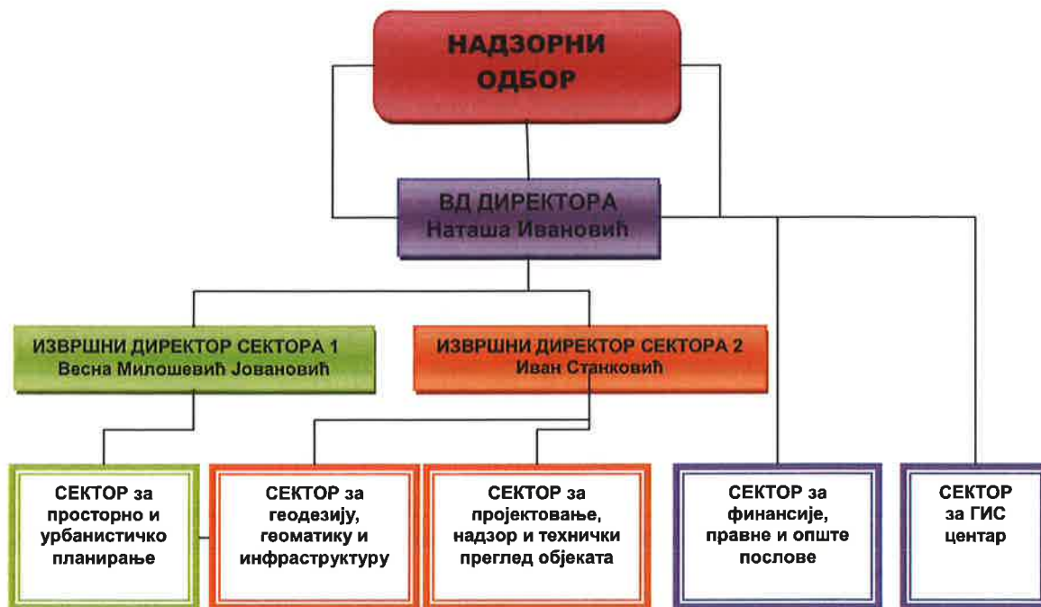
ОРГАНИЗАЦИОНА ШЕМА ЈП УРБАНИЗАМ - КРАГУЈЕВАЦ